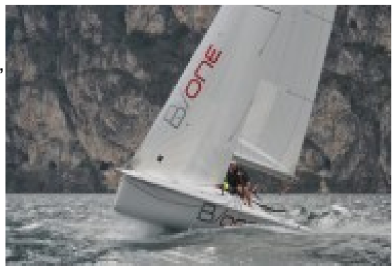
rechts Bavaria B/one