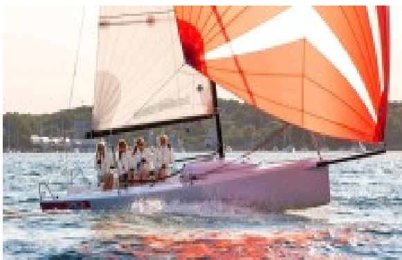
Links die J/70,