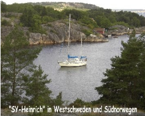
"SY-Heinrich" in Westschweden und Südnorwegen